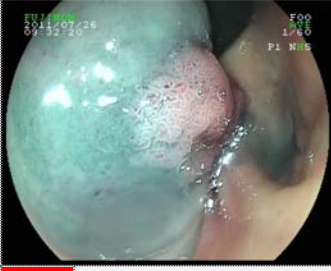
1 Rektumda polip