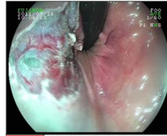
25 ESD sonu