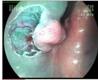
19 Endocut işlemi