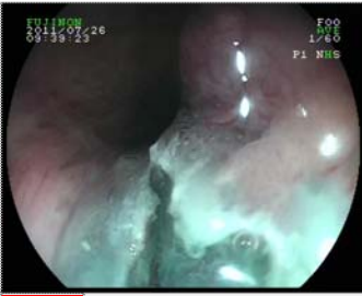
14 Endocut işlemi