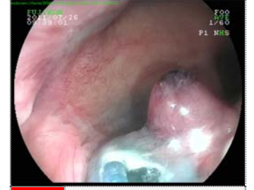
12 Endocut işlemi