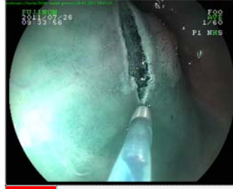
2 Endocut işlemi